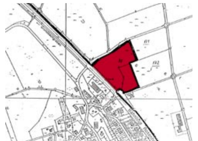
Unverständlich ist, wie man auf diese bizarre Grenzziehung für ein Gewerbeareal (rote Fläche) im Landschaftsschutzgebiet gekommen ist.