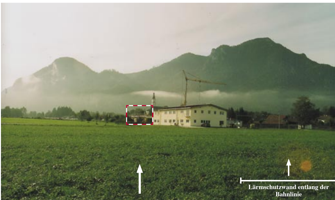
Abb. 2, 3 Massive Landschaftsveränderung durch die Errichtung der ersten Gebäude (2. Bauphase) im neuen Gewerbegebiet Flintsbach. Foto: Oktober 2004