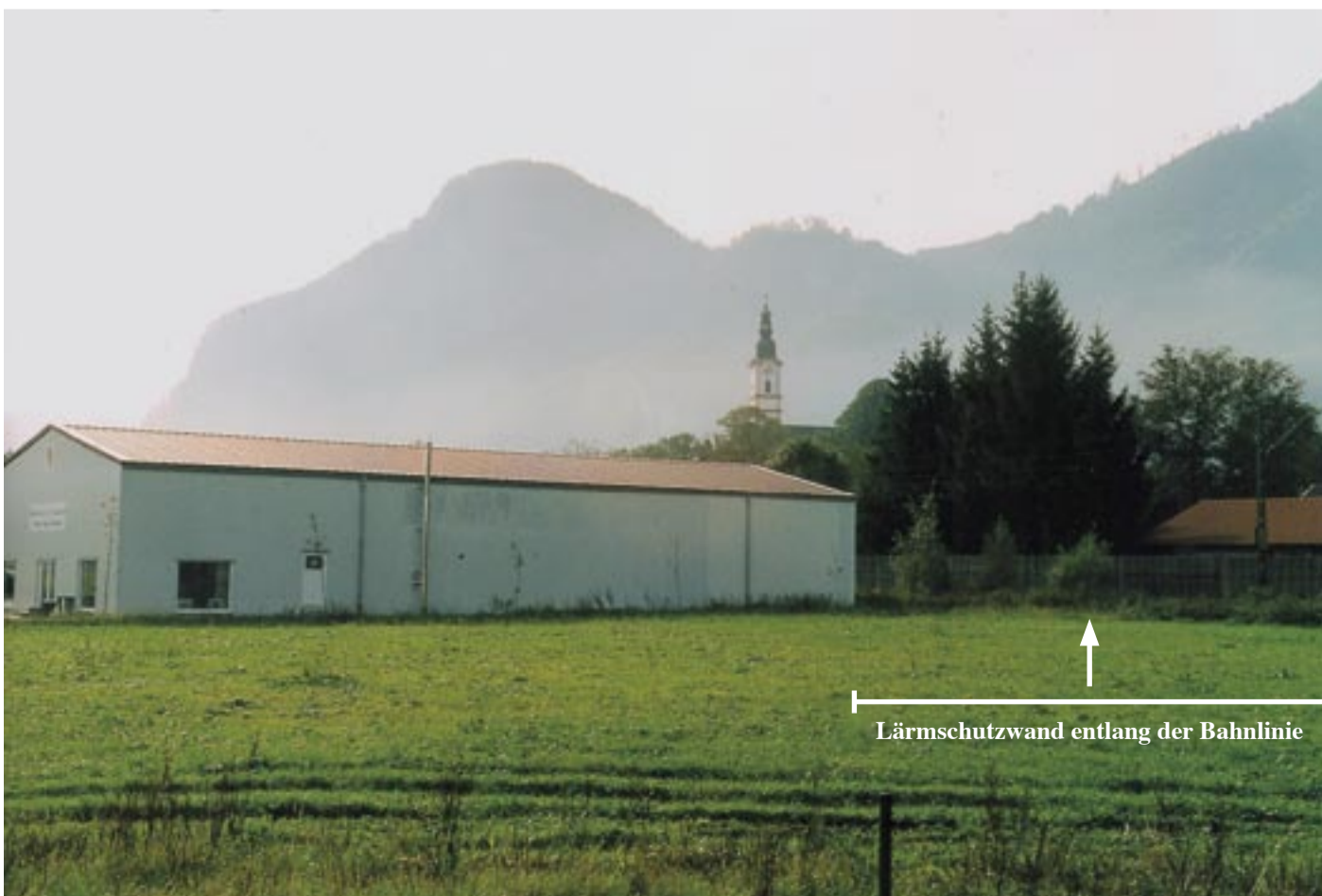
Lärmschutzwand entlang der Bahnlinie