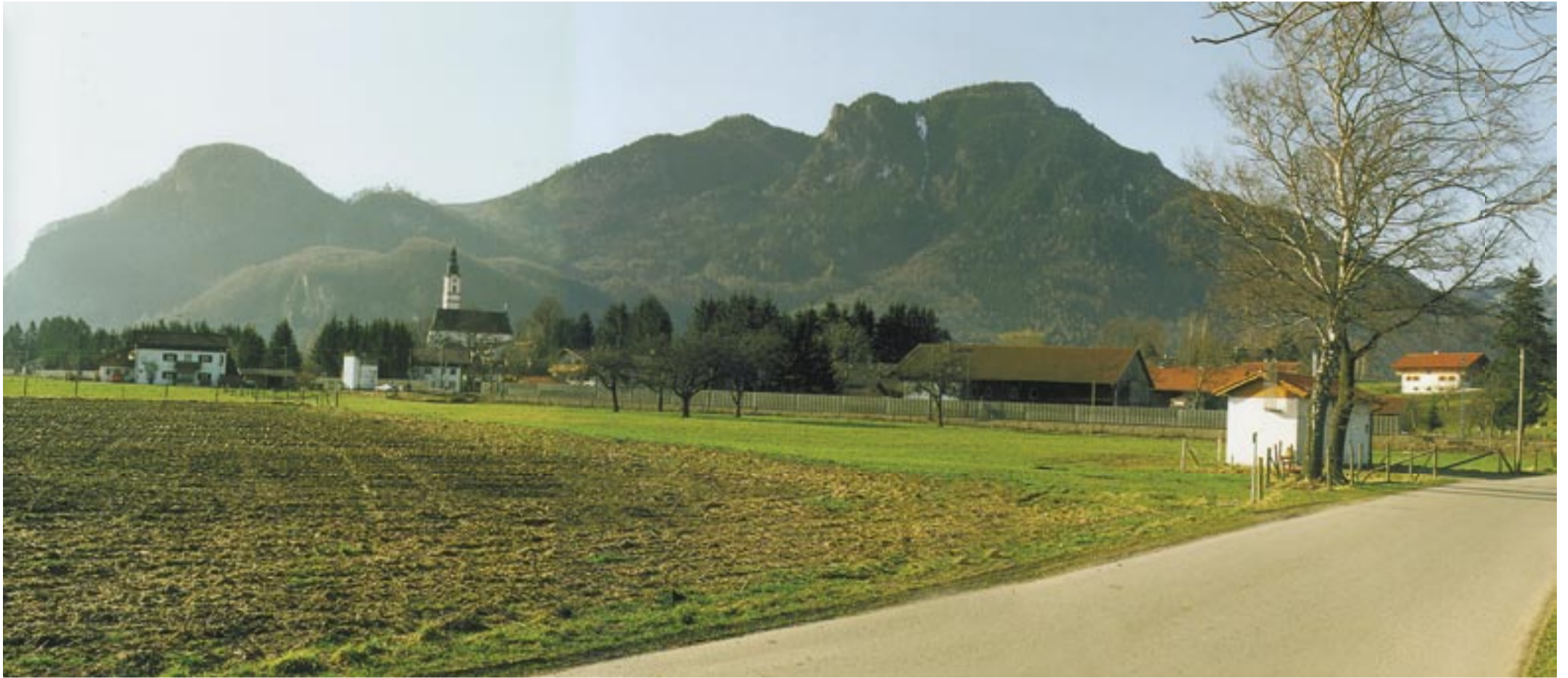
Abb. 1 Eine der schönsten Ortsansichten im Inntal ist verschwunden und für ein neues Gewerbegebiet (Flintsbach, Nußdorfer Str.) im ehemaligen Landschaftsschutzgebiet geopfert.