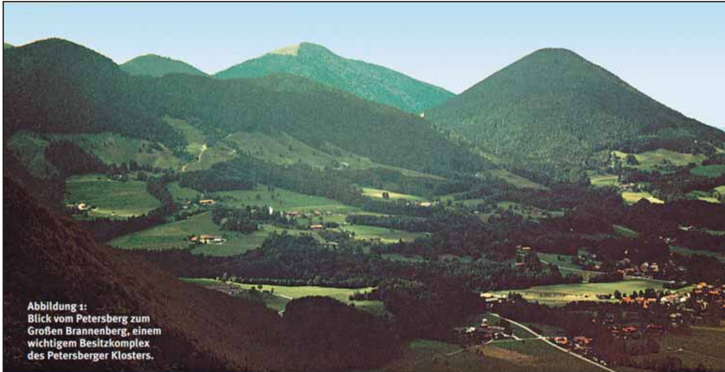
Abbildung 1: Blick vom Petersberg zum Großen Brannenberg, einem wichtigem Besitzkomplex des Petersberger Klosters.

Es geht hier um den Erhalt unserer lebenswichtigen Wasserschutzzone und unser Trinkwasser sowie um einen der schönsten Landschaftsteile in unserer Gemeinde !